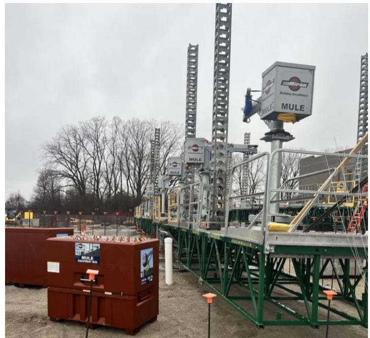
Actualmente estamos instalando la mampostería de las áreas de cocina y laboratorio.