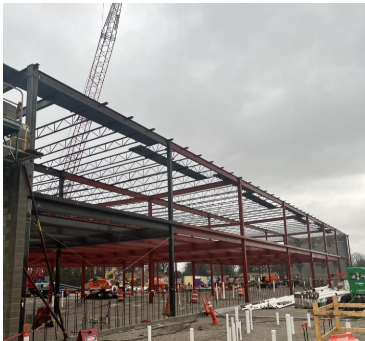
Vista desde otro ángulo del acero que se está montando en las alas de los salones de clases.