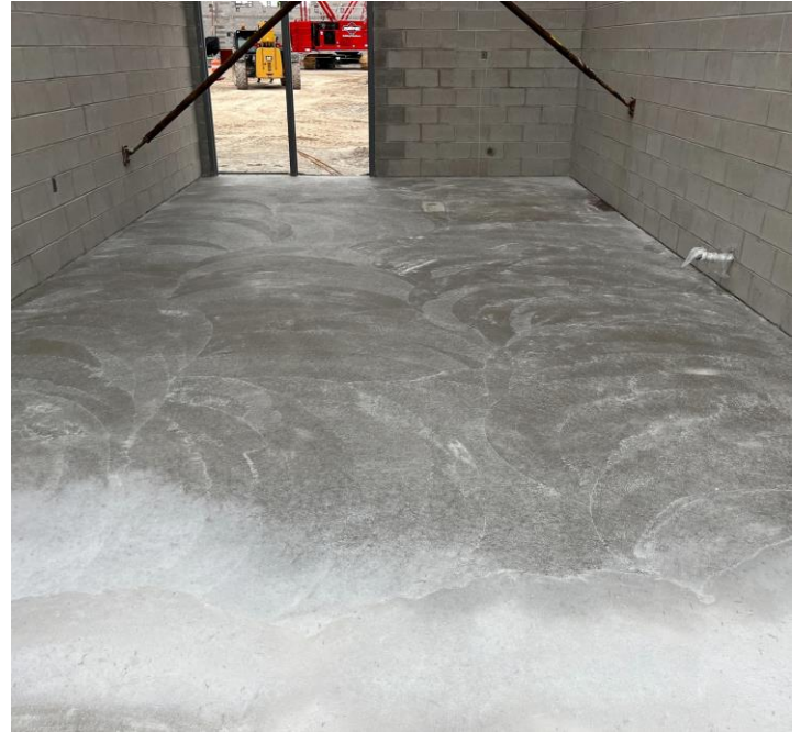
Vertida del concreto en los huecos de las escaleras.