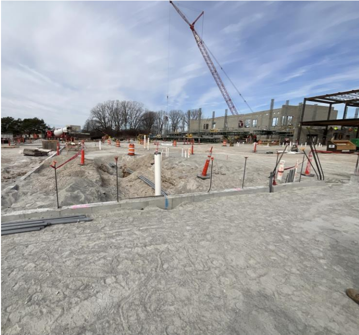
Los cimientos del edificio ya están casi terminados, así como las instalaciones eléctricas y de plomería subterránea.