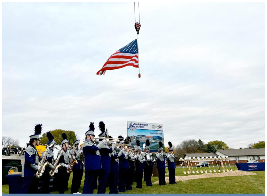
La banda de la escuela intermedia Maplewood tocó durante la ceremonia de inauguración.