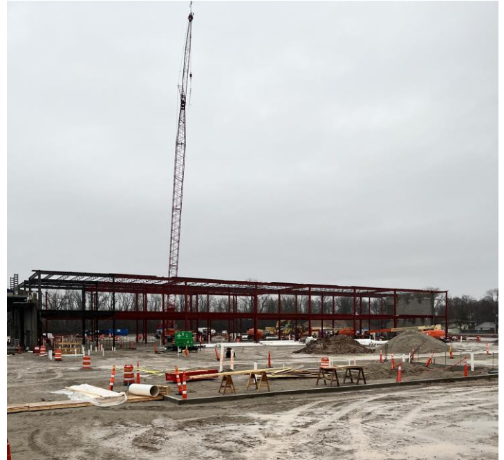
Levantamiento de las estructuras de acero de una de las alas de un salón de clases.