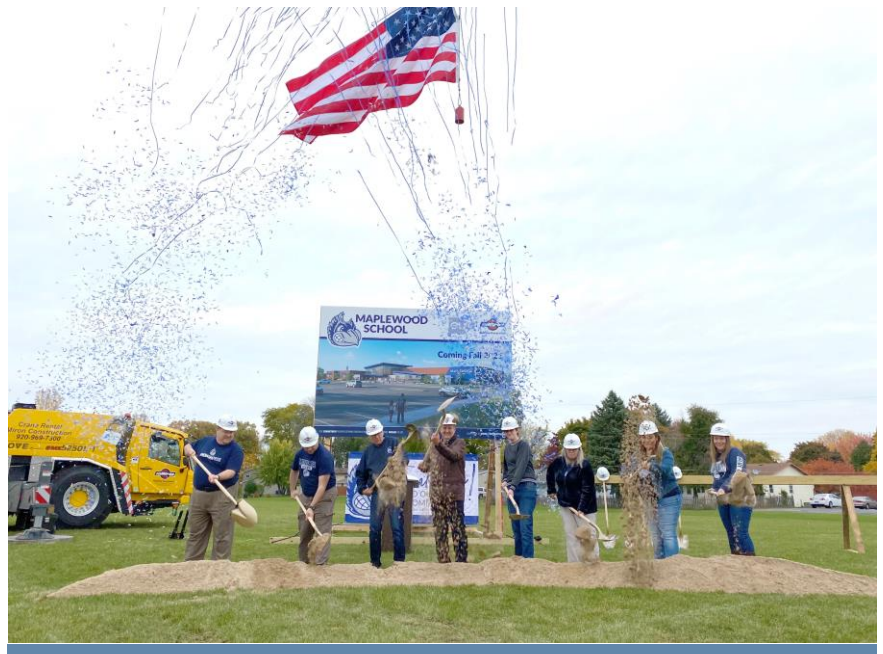
Miembros de la junta del Distrito Escolar de Menasha lideraron los giros de pala ceremoniales en la escuela Maplewood.

¡Gracias a todas las personas que asistieron a este evento!