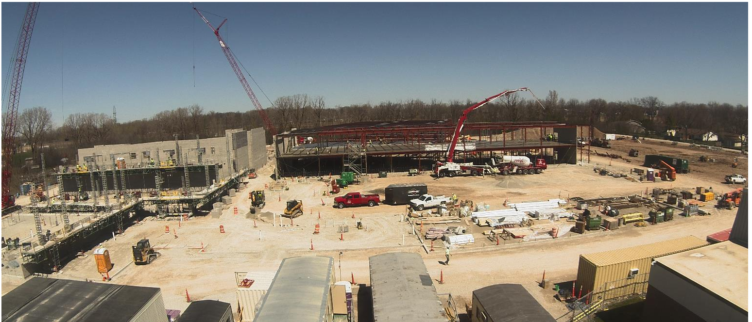
Vista desde nuestra cámara de transmisión en vivo en el lugar de trabajo, tomada el 15 de abril de 2024.